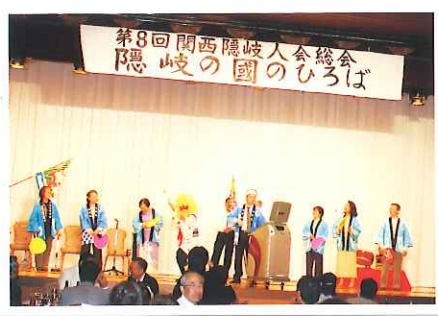
第8回総会(H24.4.15)於太閤園