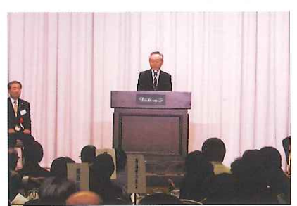
井田会長あいさつ