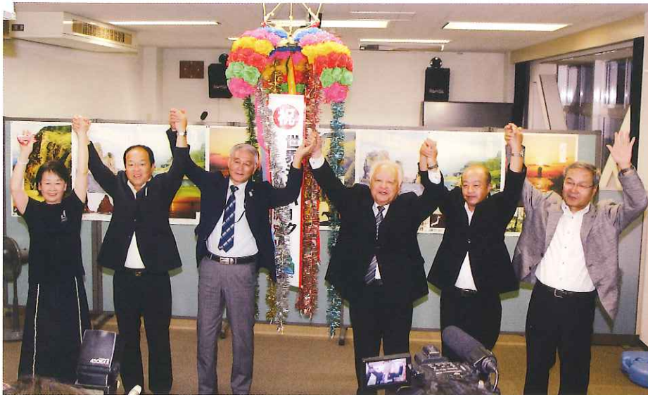
世界認定の決定の喜びの様子

「ジオパーク」とは、まだまだ、聞きなれない言葉ですが、科学的に見て特別に重要で貴重な、あるいは美しい地質遺産を含む一種の自然公園です。