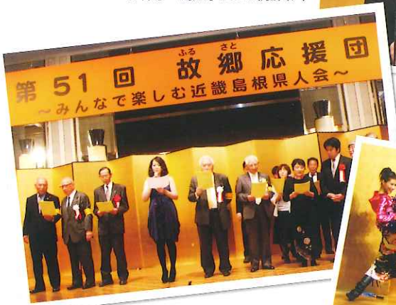
合唱の様子(▲) 「アクア☆マジック」によるパフォーマンス(▶)