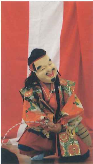
柿木少年神楽団による石見神楽の上演

年一度の定例総会には、地元吉賀町より色々な関係者のご出席をいただき、楽しい一日をすごせるように工夫しています。なかでも昔の懐かしい映像やゲーム等はとても好評です。