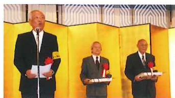
県外在住県政功労者感謝状贈呈