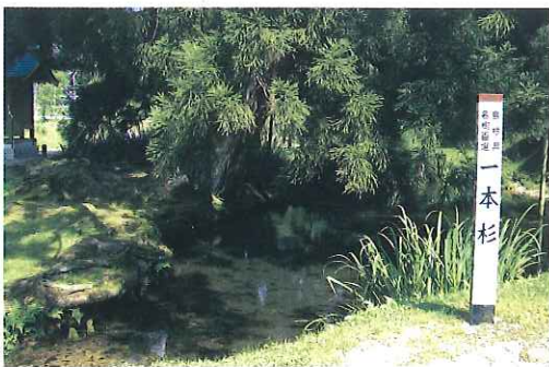
高津川源流「一本杉」

以上、今後とも会員相互の親睦を図りつつ、ふるさと吉賀町の発展に少しでもお役に立ちたいと頑張つて参ります。