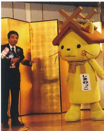
しまねっこが観光PR

第二部懇親会前には、ゆるきやらグラン プリ2014第7位の今や全国区で大活 躍中、「しまねっこ」が遊びに来てくれ、 島根県の観光PRをしてくれました。