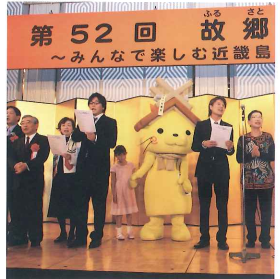
X+(えくすと)のお二人を中心にしてみなで合唱