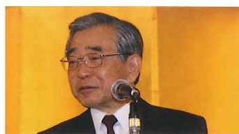
溝口善兵衛知事祝辞