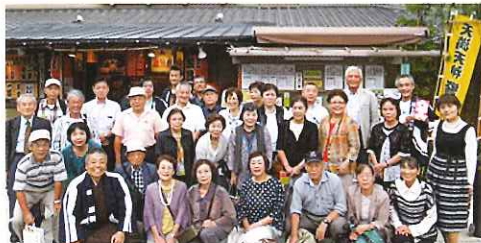
平成27年9月10日「落語鑑賞会」天満天神繁昌亭にて

上げています。今年度から出雲市による助成金も少なくなり、財政的に厳しくなるため出演者は自前で行うのを目指しており、幸いにして当会には歌つたり、踊つたり、しゃべつたりの役者には事欠かず試してみたいと思つてるところです。昨年度の活動としてはハイキングクラブによる万博公園における桜の花見会、秋には紅葉の映える箕面公園でのハイキング、旅行クラブにおいてはオリブの小豆島へ泊バス旅行、ただ、今まで長年近場の一泊旅行を続けてきていたのが頭の痛いと目ぼしいところが、無くなつてきたのが頭の痛いと