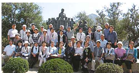
平成27年5月31日〜6月1日 小豆島一泊旅行 「24の瞳」銅像前にて

毎年外部からお招きした出演者の他に即興の飛び入りもあり賑やかに楽しい雰囲気を感じ