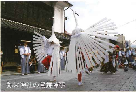
弥栄神社の鷺舞神事

こうした風景は、町民が多くの開発などから不断の努力によって現代まで守り伝えてきたからこそ、今日でも私たちは当時の津和野の情景を目にすることができるのです。