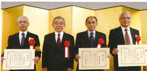
県外在住県政功労者感謝状贈呈