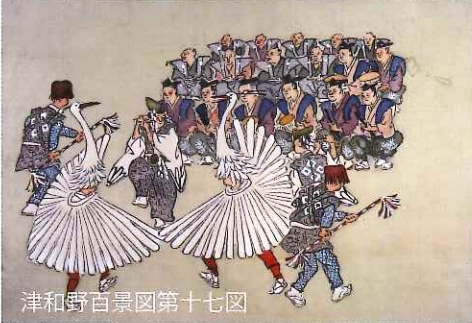
津和野百景図第十七図