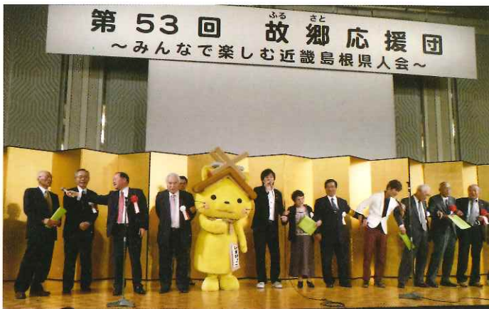
みなさんで「島根県民の歌」と「故郷」を合唱

第五十三回故郷応援団「みんなで楽しむ近畿島根県人会」が平成二十七年十一月十五日(日)、ホテルニューオータニ大阪にて溝口知事始め地元各地から多数の来賓、島根県への進出企業のみなさまを含め五百名を超える参加者が集い盛大に開催されました。