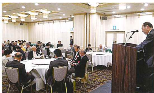
平成27年10月11日「近畿平田会総会」開催。グランヴィア大阪にて

上げています。今年度から出雲市による助成金も少なくなり、財政的に厳しくなるため出演者は自前で行うのを目指しており、幸いにして当会には歌つたり、踊つたり、しゃべつたりの役者には事欠かず試してみたいと思つてるところです。昨年度の活動としてはハイキングクラブによる万博公園における桜の花見会、秋には紅葉の映える箕面公園でのハイキング、旅行クラブにおいてはオリブの小豆島へ泊バス旅行、ただ、今まで長年近場の一泊旅行を続けてきていたのが頭の痛いと目ぼしいところが、無くなつてきたのが頭の痛いと